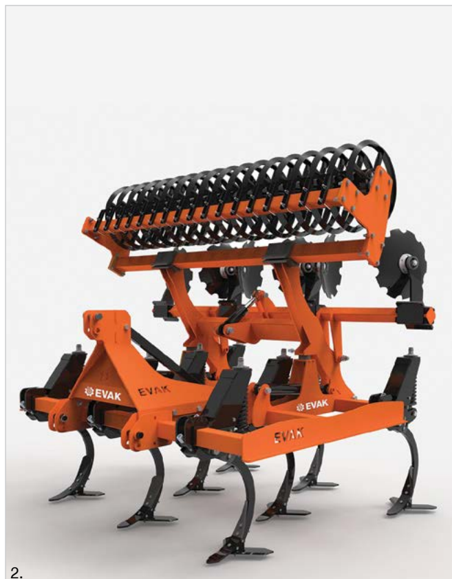
1. Bucșă de oțel de înaltă rezistență. / Втулки от високоякостна стомана 2. Discurile de nivelare și tăvălugul se pliază deasupra cadrului / Дискосвете и валакът се сгъват върху рамата